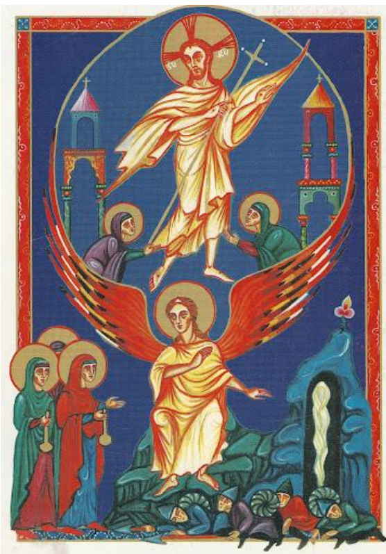
Enluminures arméniennes représentant la résurrection de notre Seigneur Jésus- Christ