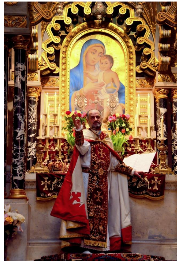
Photos de la célébration de la Sainte messe de Pâques au sein de la cathédrale Saint-Jean-Baptiste

Le Christ est ressuscité des morts, bénie soit la résurrection du Christ !